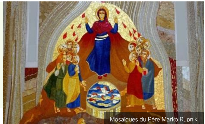
Mosaïques du Père Marko Rupnik

Pour contempler la puissance de l'Esprit Saint.