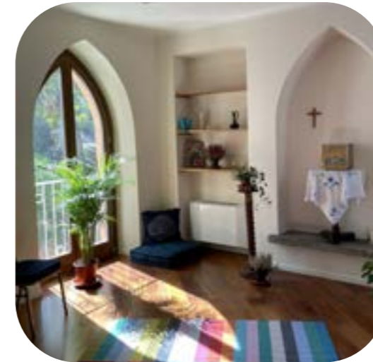
Oratorio para los participantes a las conferencias.

La recién renovada Villa Lante luce maravillosa por dentro y por fuera, gracias al duro trabajo y al extraordinario compromiso de la comunidad y del equipo de trabajo de Villa Lante, así como de los obreros de la construcción que han asumido este proyecto con mucho orgullo. Aunque todavía no está del todo terminada (la capilla se inauguró el 21 de noviembre, el jardín sólo está en la fase de garantizar la seguridad de los senderos y escalones, y las zonas del museo aún están por terminar) el Centro de Formación para Religiosos y Laicos, Villa Lante está creando mucho interés como entre aquellos que se identifican con su misión y visión.