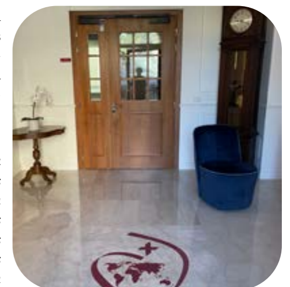
Entrada Casa Barat

El nuevo Centro de Formación para Religiosos y Laicos, Villa Lante, para el futuro próximo, es una asociación sin ánimo de lucro cuya misión es servir como centro de formación para grupos de 10 o más personas que participan en programas y reuniones que se alinean con la misión de la Sociedad del Sagrado Corazón. La Villa Lante no es una Casa de Acogida y no puede aceptar personas, familias o grupos que vengan a Roma como turistas o sólo de visita. A excepción de las RSCJ o RSCJ que acompañan a otros cuando vienen y que se harán cargo de todo lo que necesiten y comiendo fuera de la Villa Lante. Se pide un donativo a todos, incluidas las RSCJ, que utilicen el Centro. Todas las solicitudes de habitaciones deben dirigirse a Stéphane Sgrò: coordinator@villalante.org .