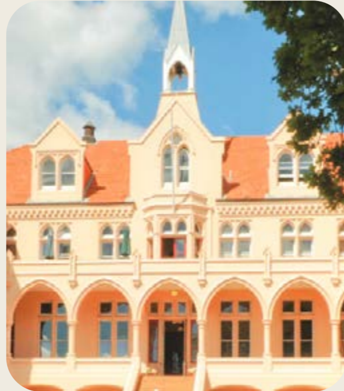
Baradene College, Auckland, Nouvelle Zelande

Au terme de la visite, les invitées du Conseil général et l'équipe de direction provinciale se sont rencontrés pour réfléchir sur les défis et les atouts de cette province.