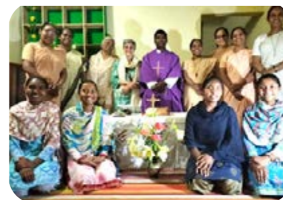
Communauté de Torpa - Renouveau des Vœux de Mukta

A vant de venir dans la Province de l'Inde pour mon expérience internationale, j'ai passé trois mois dans la Province d'Angleterre - Pays de Galles pour améliorer mon anglais. Je suis très reconnaissante à Dieu et à nos sœurs pour la merveilleuse expérience que j'ai vécue là-bas, pour leur générosité et leur amour. Chaque jour que j'ai vécu là-bas, les lieux que j'ai visités, l'académie de langues, les RSCJ et les personnes que j'ai rencontrées ont été un cadeau, une grande bénédiction du Seigneur.