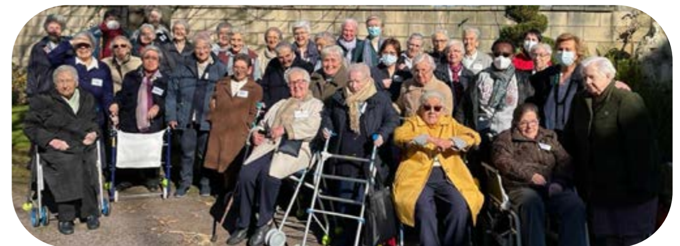
Maison des sœurs âgées d'Algorta

« Elles ont été touchées par des initiatives simples et significatives, par un désir profond d'être ouvertes aux autres et de se rejoindre. »