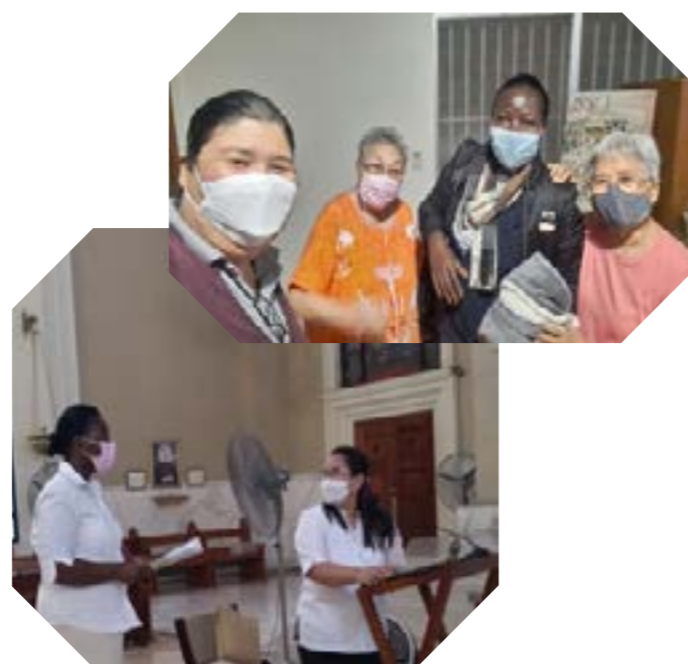
Chaque quatrième dimanche du mois, nous lisons une prière pour les vocations à la cathédrale de l'Immaculée Conception, à Cubao.

« Cette expérience a élargi mon horizon en termes de notre spiritualité, de nos différences culturelles et de notre créativité dans la prière. »