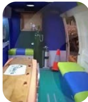
L'intérieur de l'ambulance

de la municipalité et de l'État. Une camionnette ordinaire a été transformée en ambulance et son inclusion dans le service médical a favorisé des réponses plus rapides aux urgences médicales, ce qui a permis de réduire les complications médicales. L'ambulance a apporté de la lumière et de l'espoir à la population vulnérable, l'égalité d'accès aux soins médicaux et davantage de vies ont été sauvées.