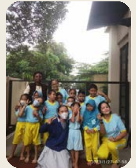
Avec les enfants de l'école maternelle de Jakarta

« J'ai vu la plupart d'entre eux se serrer la main et regarder l'autre dans les yeux, cherchant profondément à se réconcilier, ce qui a laissé une marque indélébile dans mon cœur. »