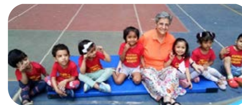
A la crèche de Mumbai

C'est pourquoi, lorsque quelqu'un me dit que je ressemble à une Indienne, mon cœur bondit de joie et je chante, je loue et je remercie Dieu pour les merveilles que son amour a accomplies dans cette Province bénie de l'Inde et pour nous avoir appelées à être des Artisans d'Espérance dans ce monde brisé et béni.