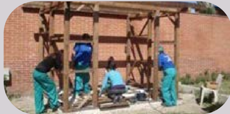
Construction de l'abri à outils

Au terme du projet, 2.500 plantes aromatiques et médicinales et 840 litres de compostage ont été produits, un abri pour les outils a été construit et un blog a été créé pour la pépinière.