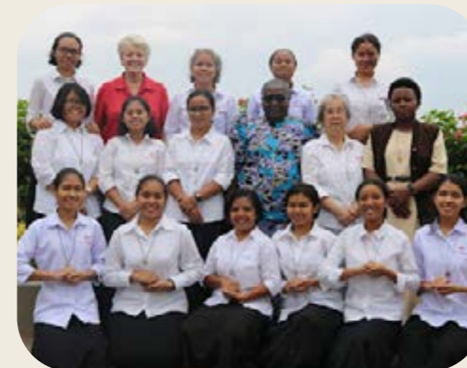
Avec les RSCJ pour l'Assemblée de District en janvier 2023

De temps en temps j'ai visité notre communauté voisine de Bogor. Cela a été une expérience merveilleuse pour moi, en particulier lorsque nous avons distribué de la nourriture aux pauvres.