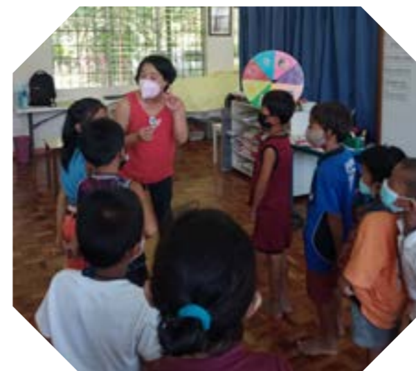
Fondation Sainte Madeleine Sophie aux Philippines