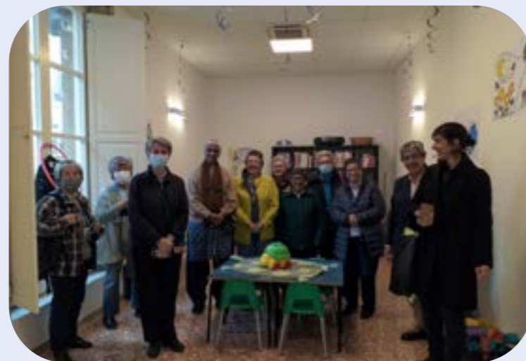
Expérience d'exposition à San Giacomo

Les participantes sont maintenant en train de retourner dans leurs provinces, animées d'un sens renouvelé de la vocation et d'une compréhension et d'un engagement plus larges à l'égard du processus en cours de la Société.