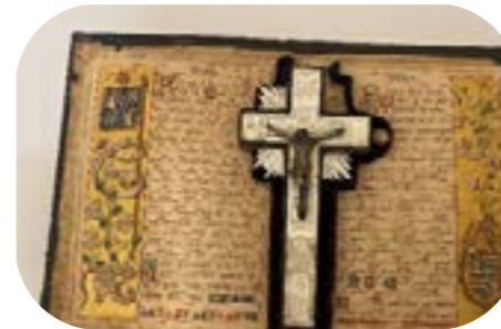
Crucifix sur des pages enluminées - 19e s Un des objets du musée