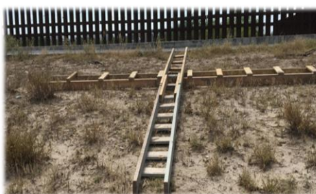
Escalier en croix

Un point saillant de l'événement a été la visite au mur frontalier entre les États-Unis et le Mexique, où de nombreuses personnes risquent leur vie dans l'espoir d'une vie meilleure.