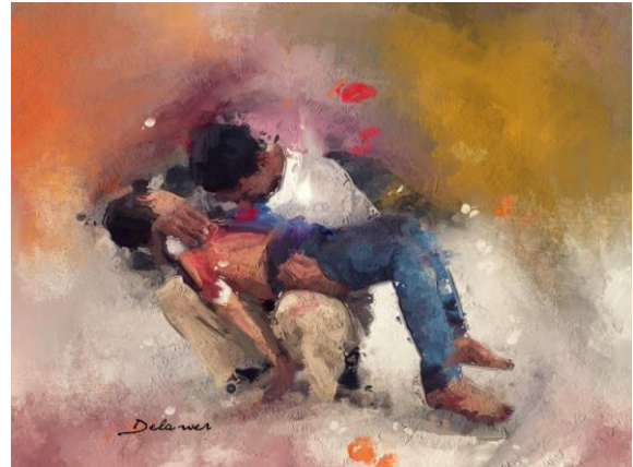
“Pieta of Syria” de Delawer Omar

El Sábado Santo nos introduce en un tiempo de silencio que transcurre entre el grito de Jesús en la Cruz y el grito que proclama que Jesús ha resucitado. Este silencio abraza todos los silencios de nuestro mundo, tantas preguntas que no encuentran respuesta, tantas vidas silenciadas... Vivamos hoy en comunión con todas esas realidades. Dejemos que el Espíritu nos adentre en el gran silencio.