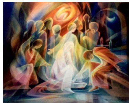
Leszek Forczek, Washing of the Feet: Light to the Darkness

Nos podemos preguntar: ¿Cómo vivo la horizontalidad y la igualdad en los grupos a los que pertenezco de vida y misión; en mis relaciones interpersonales?