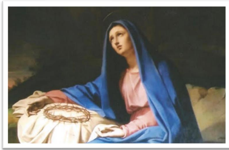
Notre-Dame des Douleurs, Villa Lante, Rome

15 septembre - Fête de Notre-Dame des Douleurs