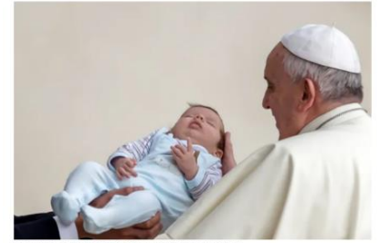
Pope Francis, pictured on Oct. 15, 2014

« Il n'y a pas de paix sans la culture du soin. La culture du soin, cet engagement commun, solidaire et participatif pour protéger et promouvoir la dignité et le bien de tous, cette disposition à s'intéresser, à prêter attention, à la compassion, à la réconciliation et à la guérison, au respect mutuel et à l'accueil réciproque, constitue une voie privilégiée pour la construction de la paix. En bien des endroits dans le monde, des parcours de paix qui conduisent à la cicatrisation des blessures sont nécessaires. Il faut des artisans de paix disposés à élaborer, avec intelligence et audace, des processus pour guérir et pour se retrouver ».