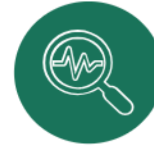
Pilots / Research