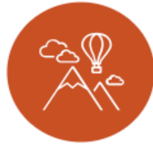
Ultimate Dialogue Adventure