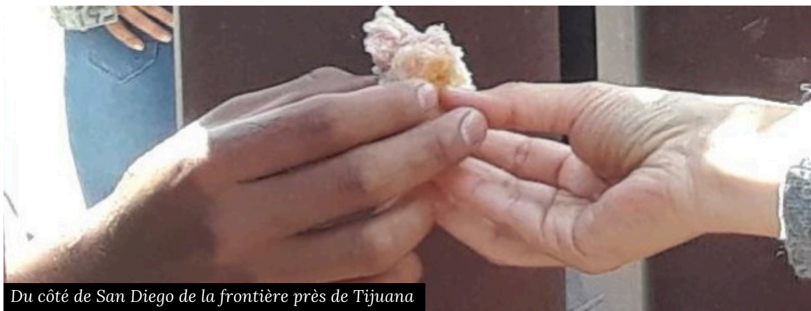
Du côté de San Diego de la frontière près de Tijuana

Chanson de clôture : Hymne Officiel du Jubilé 2025 - "Pèlerins d'espérance"