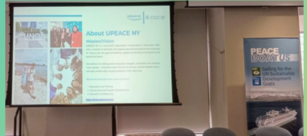
Evento paralelo sobre Peace Boat

Lo que realmente me inspiró fue el compromiso de los Estados miembros de actuar en solidaridad y unidad, fomentando la colaboración mediante la ciencia, la tecnología y una visión compartida. Su dedicación para transformar las aspiraciones en resultados tangibles y su esfuerzo colectivo por una comunidad global más unida fue profundamente motivador. Los compromisos reafirmados para cumplir con los ODS, mantener sólidas alianzas con la ONU y la convicción compartida de que alcanzar los ODS no solo es posible, sino que está a nuestro alcance, ofrecieron un renovado sentido de esperanza y propósito.