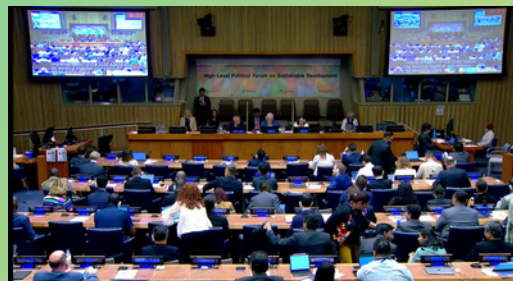
Ceremonia de clausura del FPAN

El FPAN 2025 cerró en la tarde del 23 de julio de 2025.