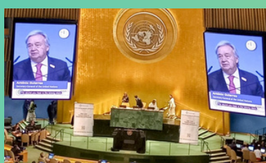
El Secretario General de la ONU, António Guterres, en la ceremonia de apertura

Avanzando en soluciones sostenibles, inclusivas y basadas en la ciencia y la evidencia para la Agenda 2030 para el Desarrollo Sostenible y sus Objetivos de Desarrollo Sostenible, sin dejar a nadie atrás.