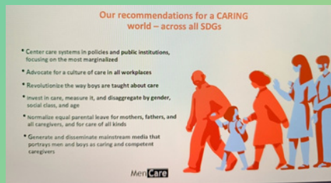
Evento paralelo sobre: «El cuidado no remunerado en el centro: un catalizador para lograr los ODS»

¡La fuerte energía de la sociedad civil!