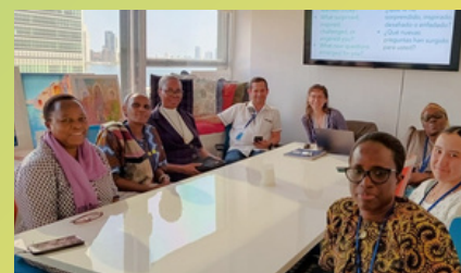
Delegados de ONG informando sobre el FPAN en la oficina de la Coalición de Justicia de Religiosos (ICOR).