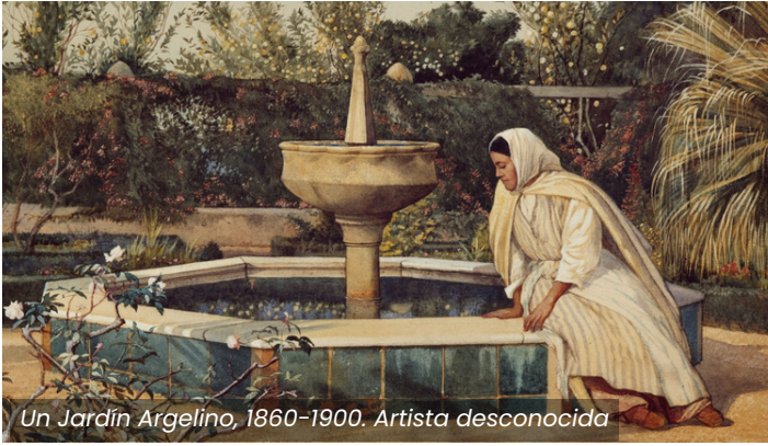
Un Jardín Argelino, 1860-1900. Artista desconocida