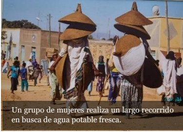
Un grupo de mujeres realiza un largo recorrido en busca de agua potable fresca.

Cada uno de nosotros está llamado a ser un artesano de la paz, uniendo y no dividiendo, extinguendo el odio y no conservándolo, abriendo las sendas del diálogo y no levantando nuevos muros. (FT 284)