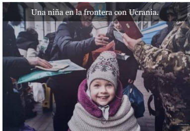
Una niña en la frontera con Ucrania.

Apreciar la riqueza y la belleza de las semillas de la vida en común que hay que buscar y cultivar juntos. (FT31)