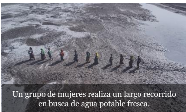
Un grupo de mujeres realiza un largo recorrido en busca de agua potable fresca.

Sonemos como una única humanidad, cada uno con la riqueza de su fe o de sus convicciones, cada uno con su propia voz, todos hermanos. (FT8)