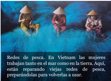
Redes de pesca. En Vietnam las mujeres trabajan tanto en el mar como en la tierra. Aquí, están reparando viejas redes de pesca, preparándolas para volverlas a usar.

Caminemos en la esperanza para abrirnos a grandes ideales que hacen la vida más bella y digna. (FT52)