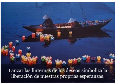
Lanzar las linternas de los deseos simboliza la liberación de nuestras propias esperanzas.

El camino es crear en los países de origen la posibilidad efectiva de vivir y de crecer con dignidad. (FT 129)