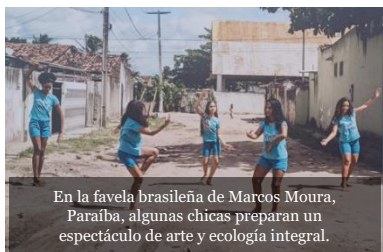
En la favela brasileña de Marcos Moura, Paraíba, algunas chicas preparan un espectáculo de arte y ecología integral.

En toda guerra lo que aparece en ruinas es el mismo proyecto de fraternidad, inscrito en la vocación de la familia humana. (FT 26)