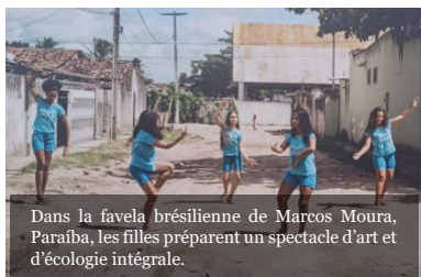
Dans la favela brésilienne de Marcos Moura, Paraíba, les filles préparent un spectacle d'art et d'écologie intégrale.

Ce qui tombe en ruine dans toute guerre, c'est le projet même de fraternité inscrit dans la vocation de la famille humaine. (FT 26)