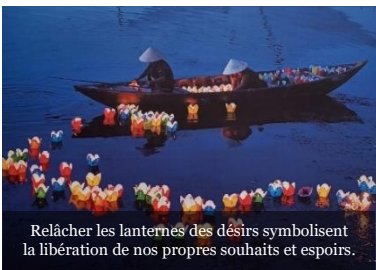
Relâcher les lanternes des désirs symbolisent la libération de nos propres souhaits et espoirs.

Il faudrait créer dans les pays d'origine la possibilité effective de vivre et de grandir dans la dignité. (FT 129)