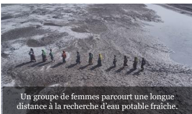
Un groupe de femmes parcourt une longue distance à la recherche d'eau potable fraîche.

Rêvons en tant qu'une seule et même humanité, chacun avec la richesse de sa foi ou de ses convictions, chacun avec sa propre voix. (FT8)