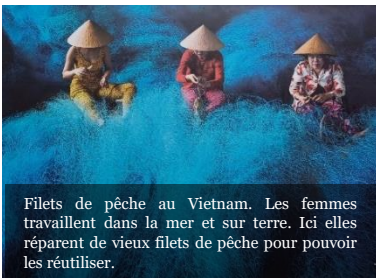
Filets de pêche au Vietnam. Les femmes travaillent dans la mer et sur terre. Ici elles réparent de vieux filets de pêche pour pouvoir les réutiliser.

Marchons dans l'espérance pour nous ouvrir à de grands idéaux qui rendent la vie plus belle et plus digne. (FT52)