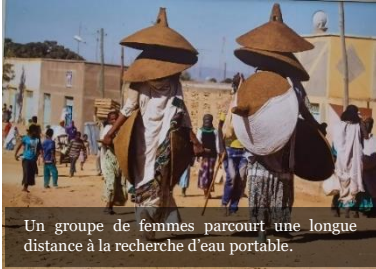
Un groupe de femmes parcourt une longue distance à la recherche d'eau potable.

Chacun de nous est appelé à être un artisan de paix, qui unit au lieu de diviser, qui étouffe la haine au lieu de l'entretenir, qui ouvre des chemins de dialogue au lieu d'élever de nouveaux murs. (FT 284)