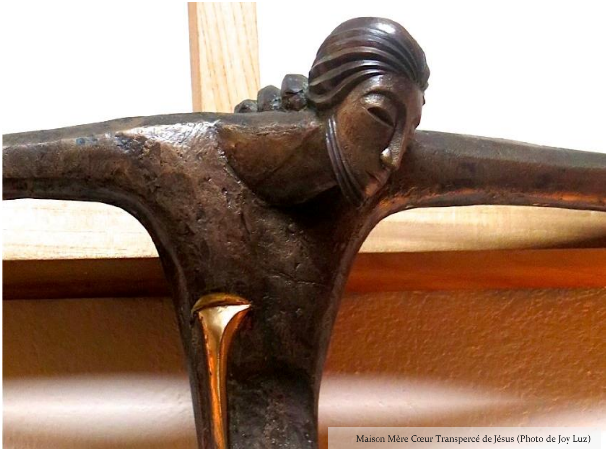
Maison Mère Cœur Transpercé de Jésus

« Restons en Jésus » en ce Vendredi Saint. Suivons-le de près alors qu'il marche sur le chemin du Calvaire et qu'il offre sa vie en toute liberté. Centrons l'attention sur Jésus - ses paroles, ses attitudes et ses actions. Nous demandons la grâce qui nous permettra de faire l'expérience de l'amour et de la passion qui lui ont permis de prendre sa croix et de remettre son esprit entre les mains de Dieu.